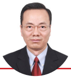
Por Wang Gang, embajador de China en Uruguay

Un gustazo celebrar este 3 de febrero los 35 años de relaciones diplomáticas Uruguay-China, en los albores del Año Nuevo Chino del Conejo, ocasión propicia para echar una mirada retrospectiva, sin pretender examinar de punta a punta, rubro por rubro, etapa por etapa, baldosa por baldosa.