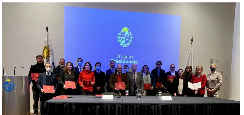
Entrega de diplomas seminario bilateral Baterías como sustitutos de combustibles fósiles y vehículos eléctricos para el Uruguay.