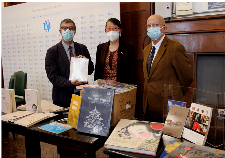
Donación libros a la Biblioteca Nacional.