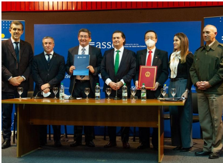
Acto de donación de equipamiento e insumos médicos.

Agencia Uruguaya de Cooperación Internacional