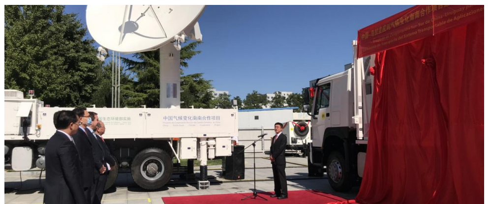
Ceremonia de embarque de donación del Sistema de aplicación móvil de recepción y procesamiento de datos meteorológicos satelitales integrados multisatélite en China.