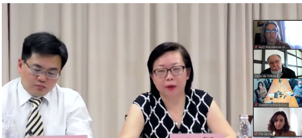
Firma de Memorando de Entendimiento sobre la Cooperación Amistosa Ribera-Guiyang.