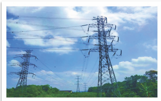
Proyecto de transmisión de energía en Ecuador