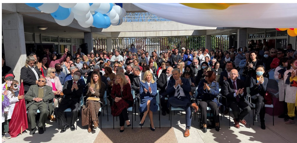
Inauguración oficial de escuela N° 319, República Popular de China.