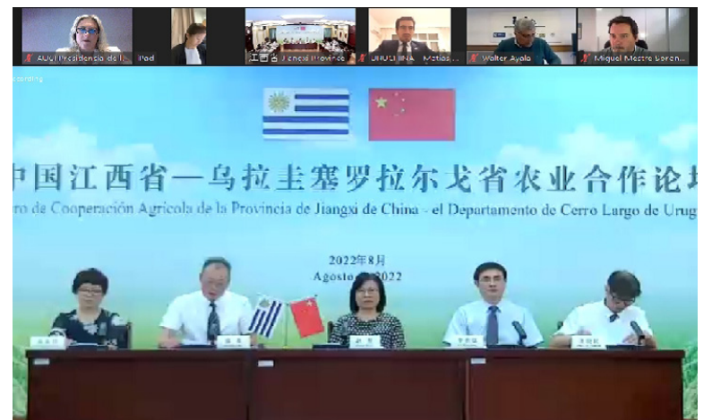
Foro de Cooperación Agrícola de la Provincia de Jiangxi de China- el Departamento de Cerro Largo de Uruguay.