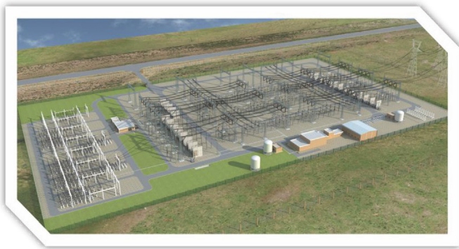
Render: Cierre del Anillo de Transmision de 500 kV

En América Latina, CMEC ha establecido sucursales o subsidiarias en México, Venezuela, Perú, Bolivia, Ecuador, Argentina y Uruguay. A lo largo de los años, hemos implementado el proyecto de renovación del ferrocarril Belgrano en Argentina, el proyecto de transmisión y transformación de energía en Ecuador, el proyecto de la planta de carbonato de litio en Bolivia, el proyecto de agua urbana en Perú, etc.