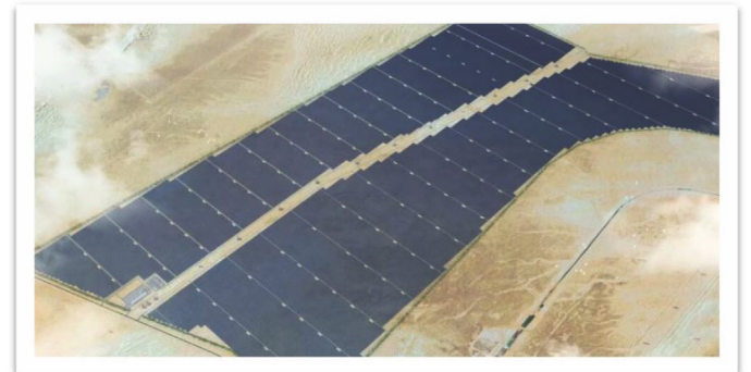
Proyecto fotovoltaico Al Dhafra en Abu Dabi