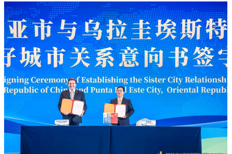
Provincia de Sanya (China) y la ciudad de Punta del Este (Uruguay), firmaron carta de intención de amistad y cooperación.