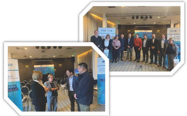
Intercambio con residentes a lo largo del Proyecto

"Porque cada día es un comienzo nuevo, porque está es la hora y el mejor momento". Este año se cumple el 35 aniversario del establecimiento de relaciones diplomáticas entre Uruguay y China. El proyecto que estamos implementando es también el primer proyecto completo a gran escala en el marco de la iniciativa de la "Franja y la Ruta" entre ambos países. Nos sentimos honrados de haber ingresado en el mercado uruguayo durante el mejor período y esperamos hacer más contribuciones a los intercambios económicos y comerciales entre Uruguay y China. ¡Que la amistad entre China y Uruguay dure para siempre!