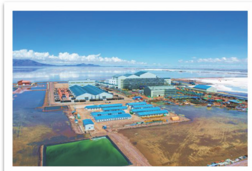
Proyecto de Fábrica de carbonato de litio en Bolivia